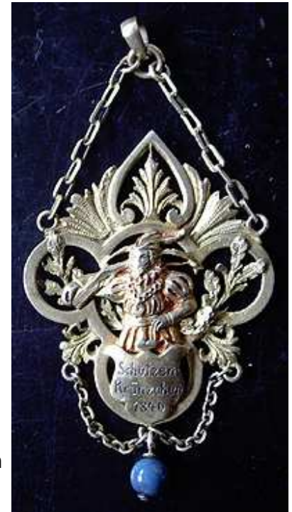
Altes Abzeichen des Schützenkränzchen 1840

Der Zimmerstutzen-Schützenbund München war die allererste Vereinigung mit „Verbands-Charakter“, die die Interessen der damals immens aufkommenden Zimmerstutzen-Schützen vertrat. Denn ansonsten gab es nur die hochherrschaftlichen Feuerschützen, die in der Münchner Hauptschützengesellschaft vereinigt waren. Das Armbrustschießen wurde ebenfalls von verschiedenen kleineren Gesellschaften gepflegt. Es sollte aber noch viele Jahrzehnte dauern, bis das zuerst belächelte Zimmerstutzenschießen auch von den alteingesessenen Feuerschützen anerkannt und ausgeübt wurde. Denn viele Feuerschützen pflegten später das Zimmerschießen, um vor allem in den Wintermonaten in Übung zu bleiben, wenn das Feuerschießen witterungsbedingt pausierte.